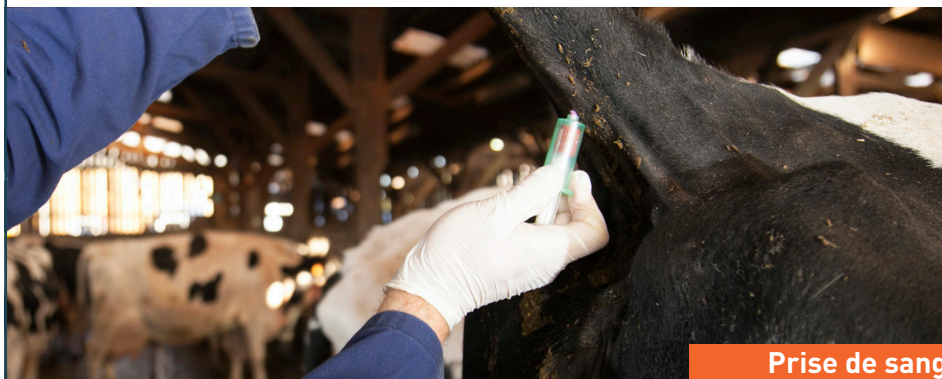
Prise de sang