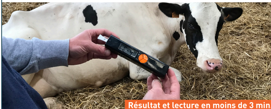
Résultat et lecture en moins de 3 min.